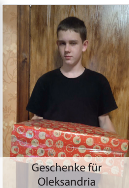
Geschenke für Oleksandria