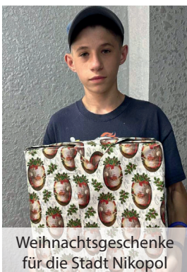
Weihnachtsgeschenke für die Stadt Nikopol