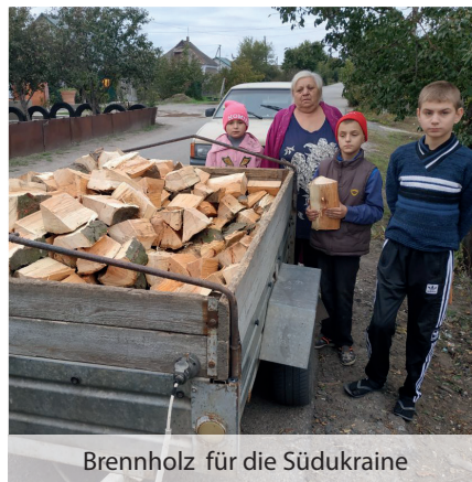
Brennholz für die Südukraine