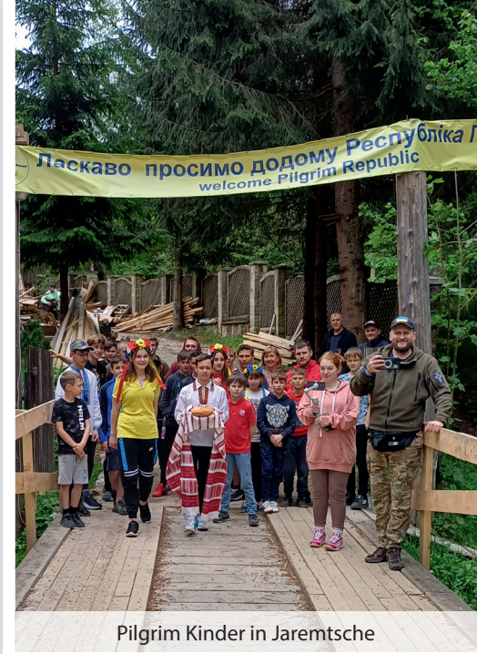
Pilgrim Kinder in Jaremtsche

Wir erinnern uns noch sehr genau! Es war Ende Februar 2022 als die Kinder aus dem Waisenheim der Hafenstadt Mariupol fluchtartig das Don Bass Gebiet verlassen haben. Die russische Armee war nur ein paar Kilometer von den Kindern entfernt. Man hörte die