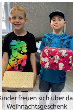
Kinder freuen sich über das Weihnachtsgeschenk